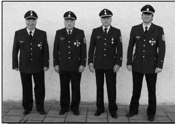
(von links nach rechts)

A nlässlich des Volkstrauertages nutzten wir die Gelegenheit einmal wieder, alle Aktiven und Passiven auf einem Mannschaftsfoto abzulichten. Nebenbei waren alle Abteilungsführer der letzten Jahre anwesend. Herausgekommen ist ein nicht alltägliches Foto über knapp 40 Jahre Abteilungsführung in der Oberförhringer Feuerwehr.